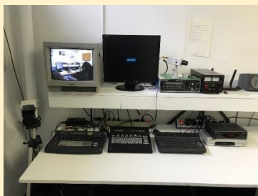
van de ATV opstelling