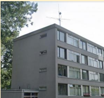
Ons noodlijdende antennepark

We hopen dat er weer veel activiteit in de Shack komt en dat er voor iedereen wat te doen is. Heb je ideeën of wil je ons helpen, laat het ons dan even weten. Alle hulp is welkom.