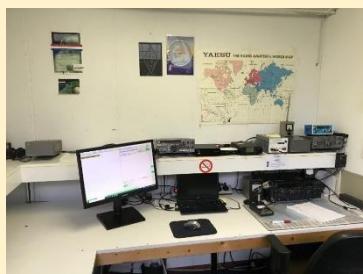
met het HF station