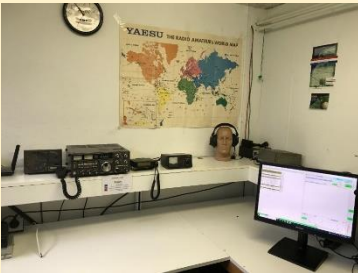
Het VHF-UHF station

Okay, het is misschien dan niet de allernieuwste apparaat, maar je kunt je lekker uitleven en volop verbindingen maken.